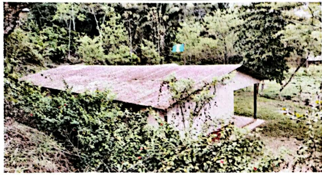
FOTO 1: Se observa el mal estado del techo parte de atrás del edificio escolar.