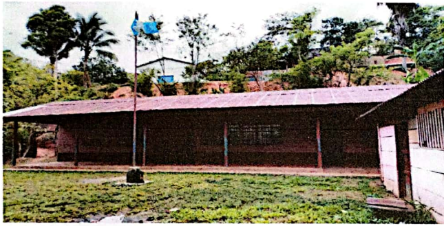
FOTO 3: Se observa la parte frontal del edificio escolar y el techo en mal estado.