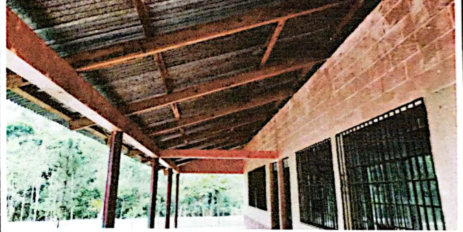
FOTO 4: Se observa las costaneras de maera que es necesario sustituirlos por metal.