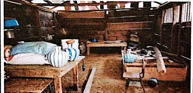
FOTO 6: Se observa el piso de la cocina que es de tierra y que es necesario hacerlo de concreto.

Observación: Si es necesario se pueden agregar hojas adicionales y actualizar el número de hojas.